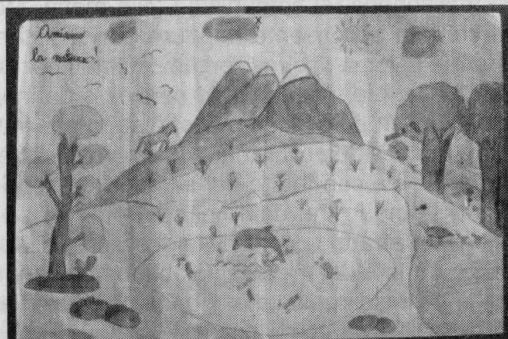
classe III: Barile Laura

L'osservatore viene catturato dall'immediatezza del disegno cogliendo il messaggio proposto.