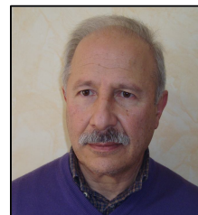
Regolo Ricci Coll. Revisori