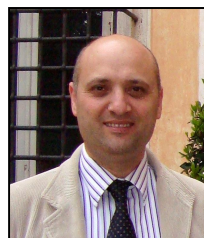
Giovanni Marro Coll. Revisori